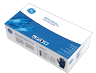
Caja de 100 Piezas