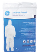
Bolsa de Poliuretano