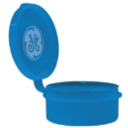
Estuche de Almacenamiento