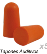
Tapones Auditivos x5