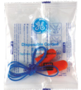
Bolsa de Poliuretano