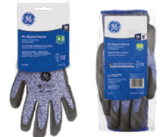
Tarjeta Colgante 12-Pack